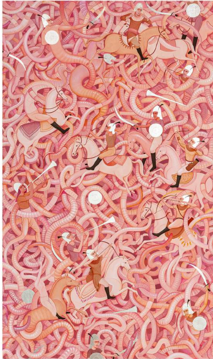
Untitled, 2023 | Acrylic and silver leaf on canvas | 220 x 130 cm