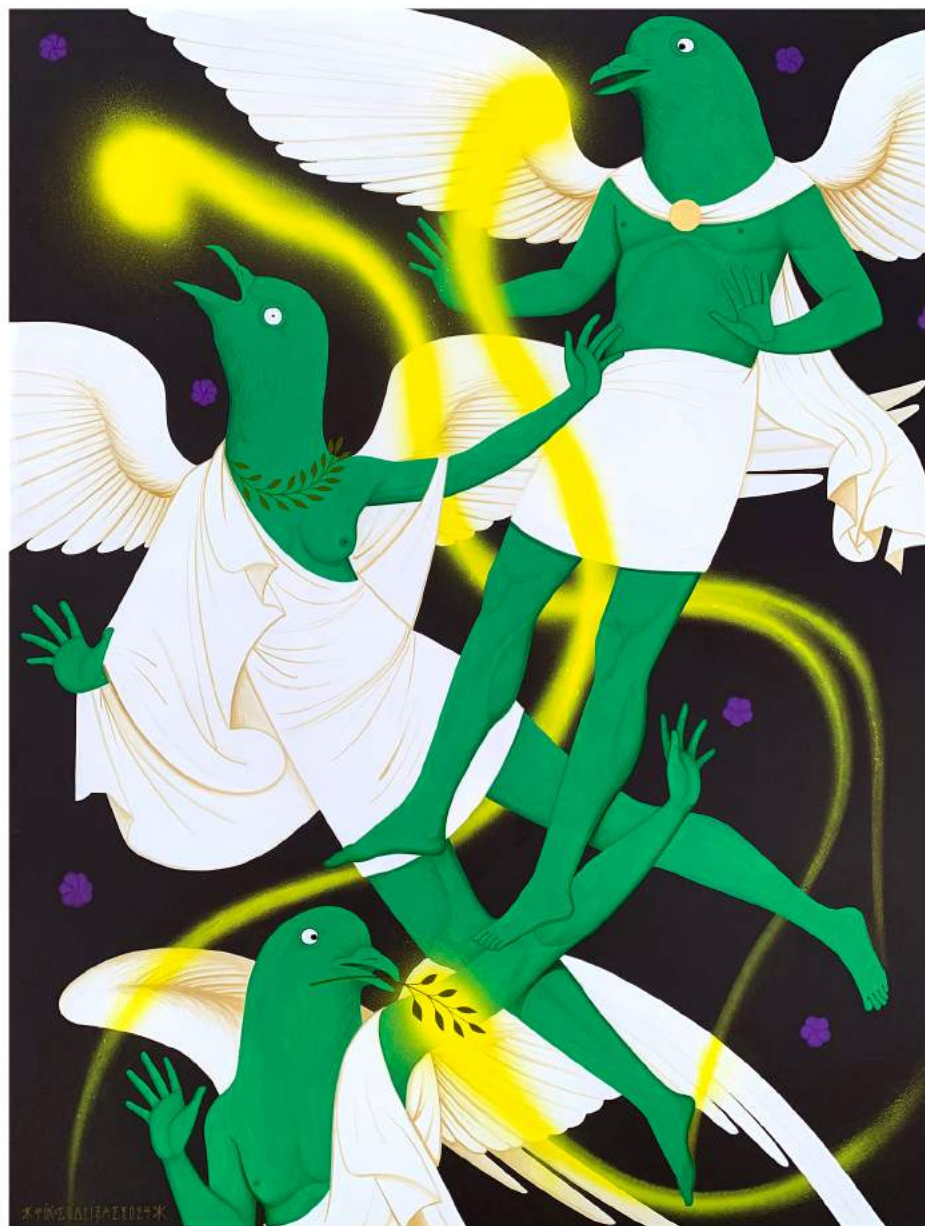
Untitled, 2024 | Acrylic, spray and gold leaf on canvas | 100 x 70 cm