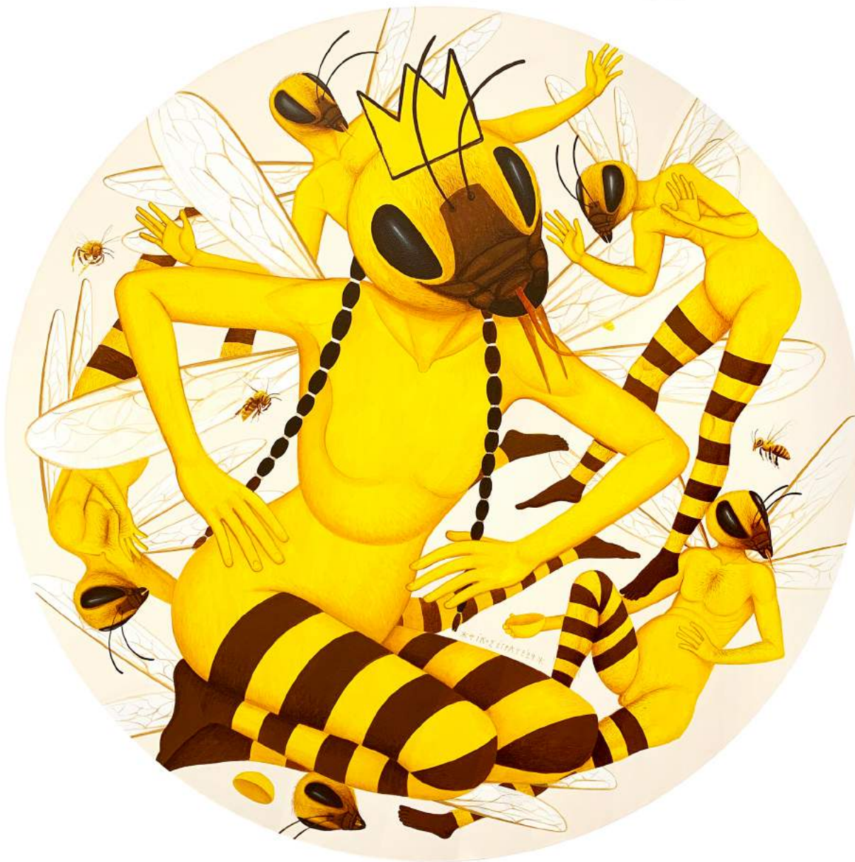
Untitled, 2024 | Acrylic and gold leaf on canvas | 90 cm