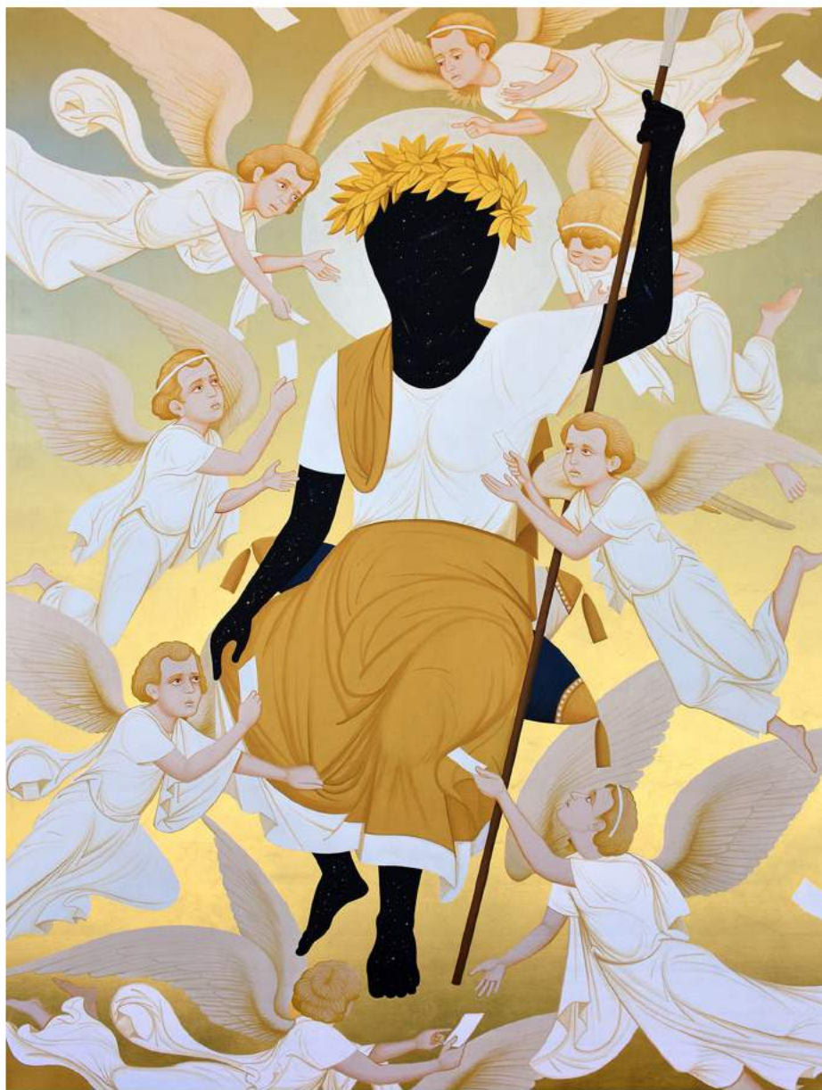
Untitled, 2024 | Acrylic and gold leaf on canvas | 200 x 150 cm