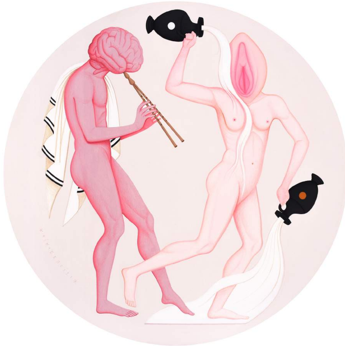
Untitled, 2024 | Acrylic on canvas | 60 cm