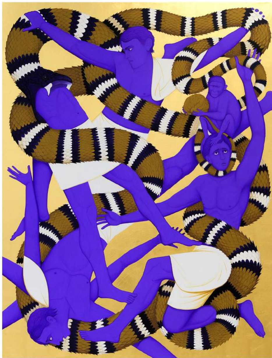
Untitled, 2024 | Acrylic and gold leaf on canvas | 150 x 115 cm