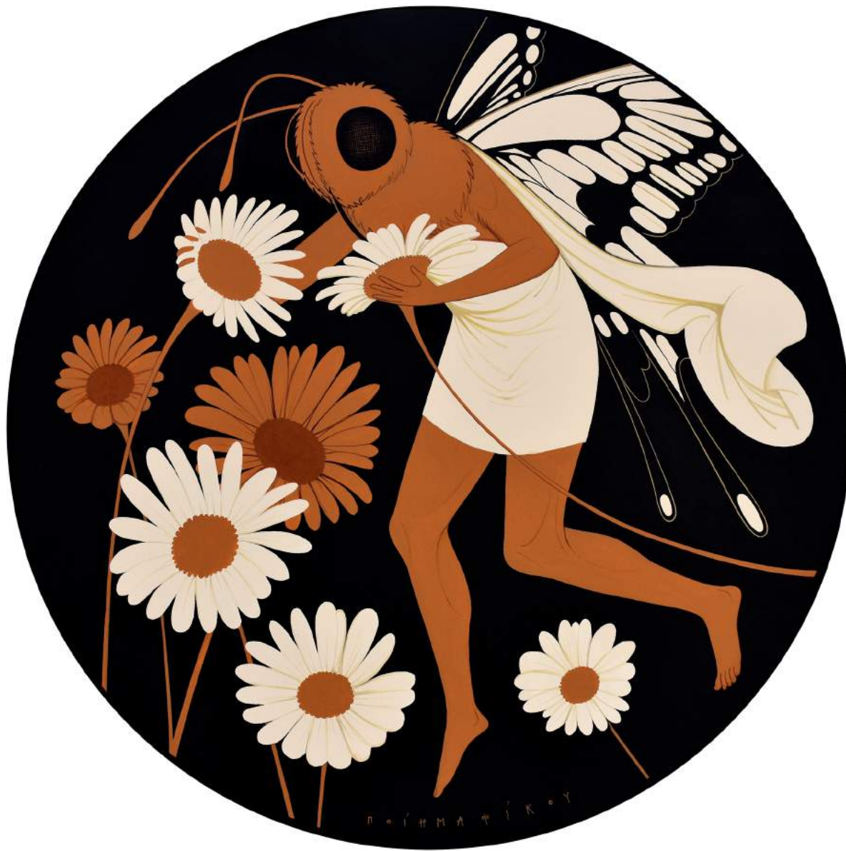
Untitled, 2024 | Acrylic on canvas | 60 cm