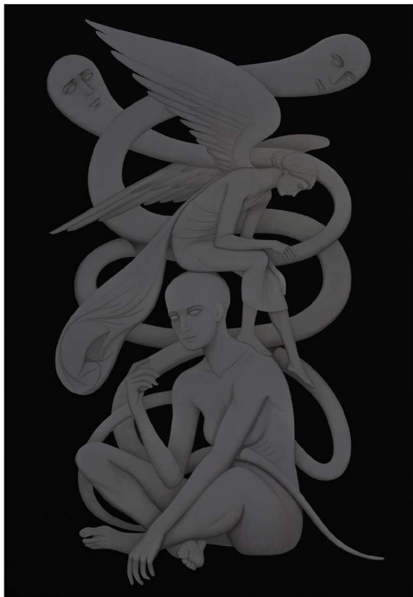
Untitled, 2023 | Acrylic on canvas | 179 x 125 cm