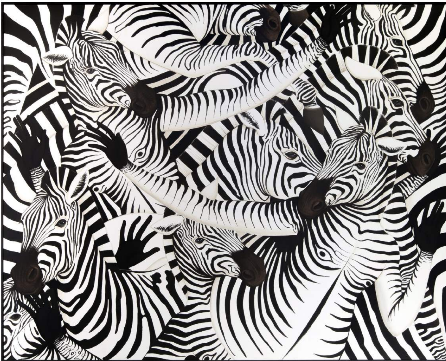
Untitled, 2024 | Acrylic on canvas | 160 x 200 cm