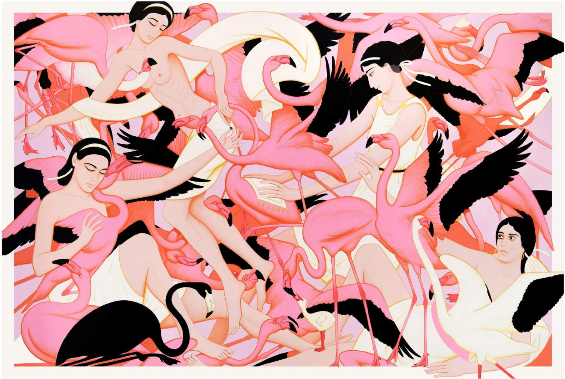
Untitled, 2024 | Acrylic and gold leaf on canvas | 200 x 300 cm